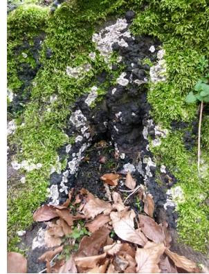
'Indsunken' bark uden frugtlegemer