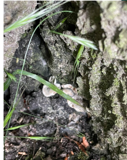
Alfas første fund