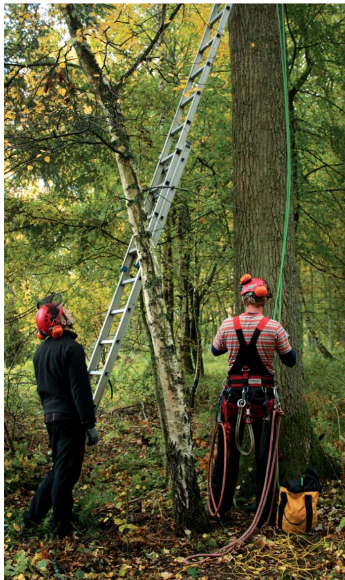
Fra en dansk ETW-eksamen, her klatringen som formentligt afholder en del fra at gå efter certificeringen.

Det lille antal certificerede træplejere kan i sig selv være et problem når f.eks. kommunerne skal udbyde træpleje.