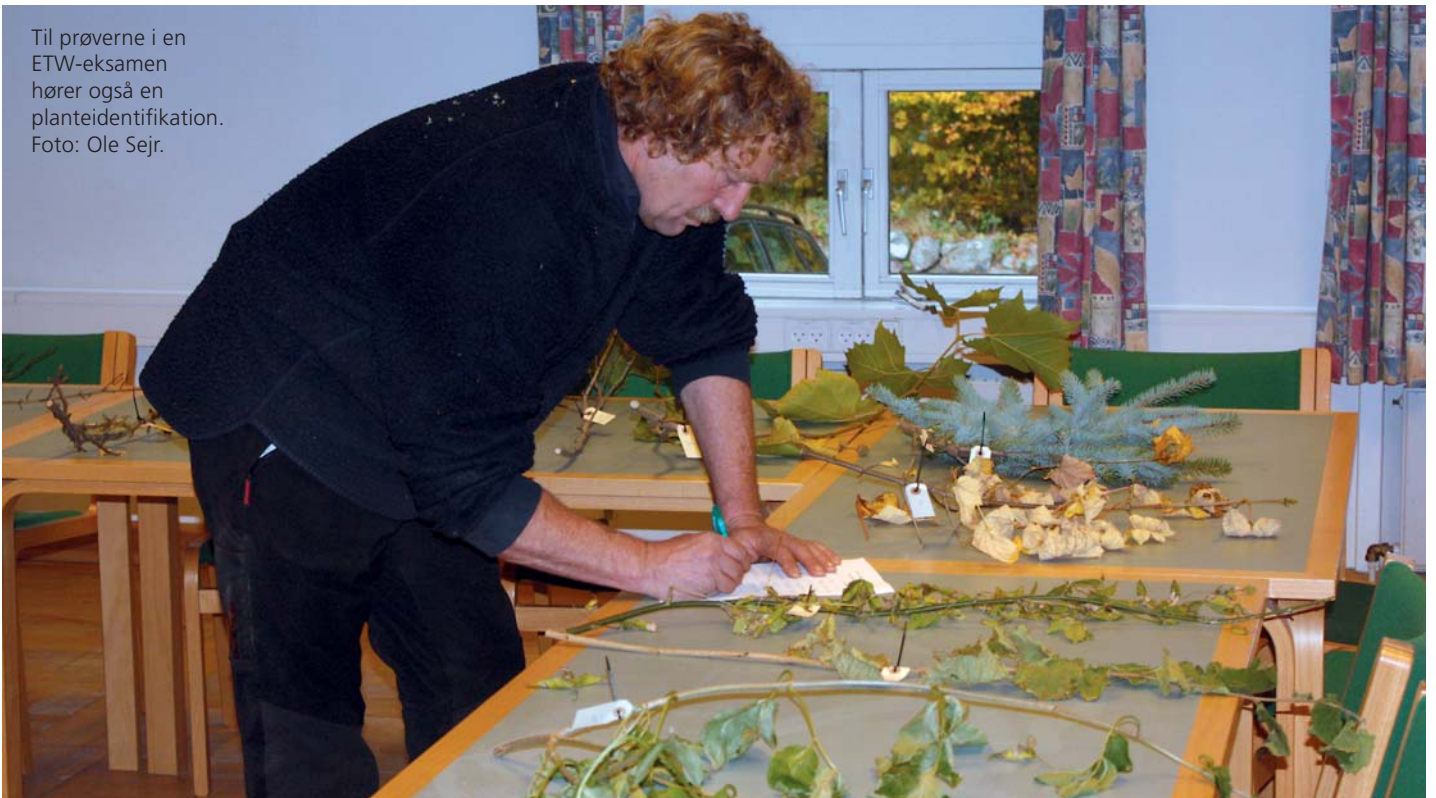
Til prøverne i en ETW-eksamen hører også en planteidentifikation.

„Meget få kunder stiller krav om certifikat. Mange me-